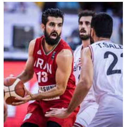
تیم ملی بسکتبال ایران مقابل سوریه شکست خورد تا کار صعود به کاپ آسیا به پنجره سوم کشیده شود.