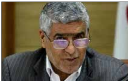
مردم گام بردارد.

وی با بیان اینکه ۲۳ دستگاه و نهاد اجرایی استان البرز مشمول بندج ماده ۳۷ هستند، اظهار کرد: ادارات و دستگاه های اجرایی باید سهم یک درصد بودجه فرهنگی و تبلیغی خود را صرف تولید محتوا کنند تا بر این اساس بتوانند داده های مورد نیاز و تأثیرگذار را در اختیار رسانه ها قرار دهند، باید بدانیم که این امر از اهمیت بسزایی برخوردار است.