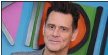
از جیم کری تا مارک روفالو؛

مایکل مور مستندساز برنده اسکار خطاب به ترامپ گفت: کارمان با تو تمام نشده و دادگاه و زندان در انتظارت است. در حالی که دونالد ترامپ داشت برای آخرین بار کاخ سفید را ترک می کرد، مایکل مور فیلمساز سخنان خداحافظی اش را در توئیتر برای او فرستاد. این مستندساز برنده جایزه اسکار نوشت: «او همین حالا کاخ سفید را برای همیشه ترک کرده است. ما مردم او را بیرون انداختیم.» او اضافه کرد: «او بر فراز خرابی هایی که خلق کرده پرواز می کند و این در حالی است که می داند کارمان با او تمام نشده. دادگاه، محکومیت، زندان، او باید سزای اعمالش را بدهد و این نخستین بار خواهد بود که این اتفاق برایش می افتد.» انتظار می رود سنای آمریکا به زودی دادگاه استیضاح ترامپ را حتی با وجود تمام شدن دوران ریاست جمهوری او برگزار کند و نتیجه نهایی می تواند به این معنی باشد که وی دیگر نتواند رییس جمهور شود. این فیلمساز همچنین در هنگام آخرین سخنرانی ترامپ توئیتر کرده بود: «ترامپ! ساکت شو! برو بیرون! بازنده! بزرگترین بازنده تاریخ! زندان فدرال. ۳ غذای خوب در روز.» مور حالا همچنین می تواند نفسی راحت بکشد چون یکی از پیش بینی هایش به حقیقت نپیوست. او در مصاحبه ای در دسامبر گفته بود که با توجه به شواهدی که از ایالت های کلیدی دیده، «اگر همین امروز رای گیری برگزار شود من باور دارم که او برنده ایالت های اکثرال مورد نیاز خواهد شد چون با توجه به زندگی کردن خودم در آن ها به شما می گویم که درجه حمایت از او ذره ای کم نشده است.»