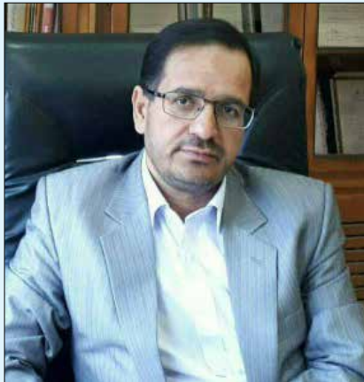
جشنواره بین المللی تئاتر فجر همزمان با سالگرد پیروزی شکوهمند جمهوری اسلامی ایران از ۱۰ لغایت ۲۰ بهمن برگزار می شود.