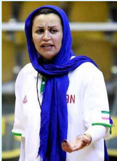
سرمربی تیم ملی بسکتبال زنان ایران می‌گوید ملی‌پوشان به آمادگی خوبی برای حضور در قهرمانی دسته دوم آسیا رسیده‌اند.

سرمربی تیم ملی بسکتبال زنان در مورد شانس ایران به صعود به دسته اول آسیا بیان کرد: کار را شروع کرده‌ایم و باید دید مثبتی داشته باشیم. با تمام توان در مسابقات حاضر می‌شویم و موفقیت ما بستگی به این دارد که بازیکنان چقدر روی برنامه‌هایی که در نظر گرفته‌ایم، تمرکز می‌کنند.